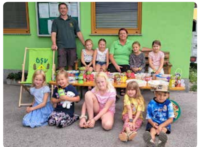
Beim Kinderprogramm wird gebastelt und entdeckt