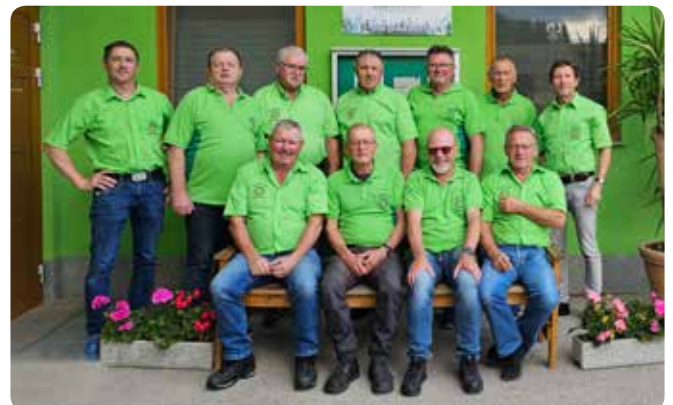
Geräteausgeber des Siedlervereins vor dem Vereinshaus