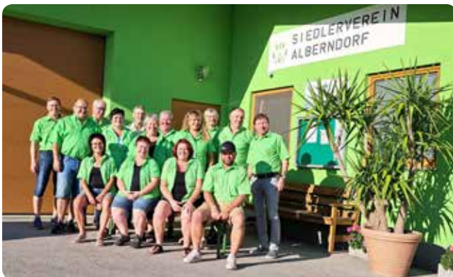
Vorstand des Siedlervereins Alberndorf vor dem Vereinshaus

Mit zunehmender Siedlungstätigkeit ab den 1970er Jahren entstand das Bedürfnis nach einer gemeinsamen Interessensvertretung. Im Vordergrund stand die Überlegung einer gemeinschaftlichen Geräteanschaffung mit Verleih an die Mitglieder. Aber auch um die Themen „Rund um den Garten“, wie etwa Gartenfachberatung, Baumschnitt- und Veredelung, Schädlingsbekämpfung usw., sollte sich die künftige Organisation annehmen.