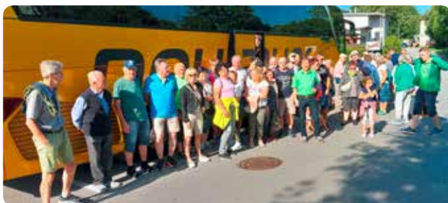
Geselligkeit ist dem Siedlerverein wichtig: Faschingskehrhaus (anno dazumal), Feste und Ausflüge werden durchgeführt