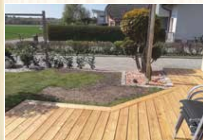
Terrassen von Nagler Holz