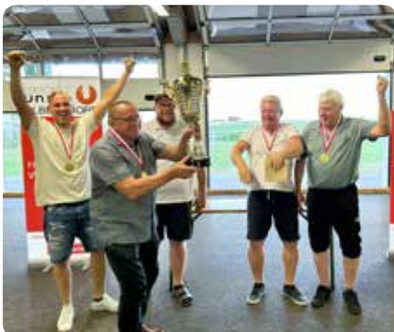
Das Team HUGO gewinnt die Ortsmeisterschaft 2024

Nach der Siegerehrung wurden beim gemütlichen Beisammensitzen die Erfolge des Tages gefeiert.