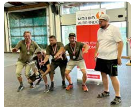
Sparverein Palermo errang den 3. Platz in der Ortsmeisterschaft