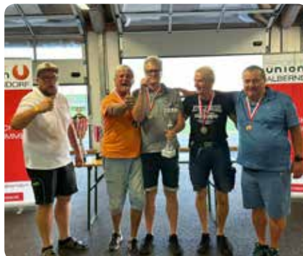
Die Stockschützengruppe Jäger musste sich dem Team HUGO geschlagen geben