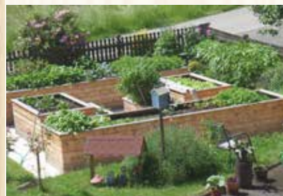
Garten- hochbeete von Nagler-Holz

E-Mail: office@nagler-holz.at | www.nagler-holz.at