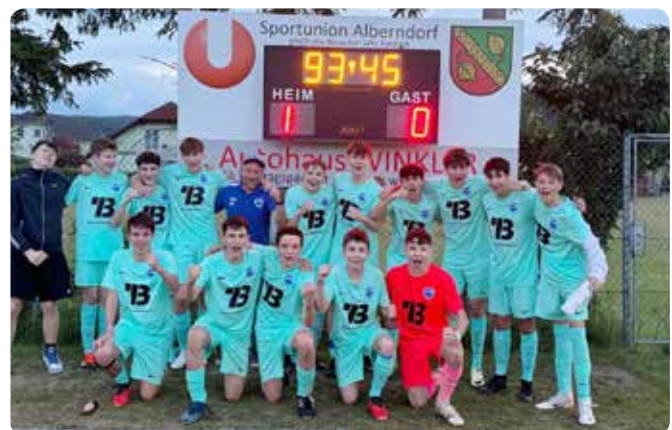
Die U16 ist sehr erfolgreich und siegte 11:2 gegen Gutau