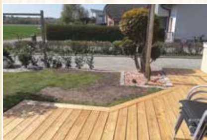
Terrassen von Nagler Holz