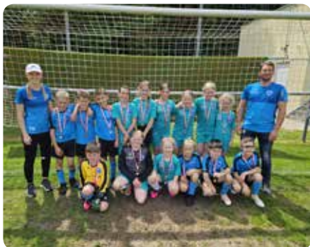
U9 Mädchen und Burschen