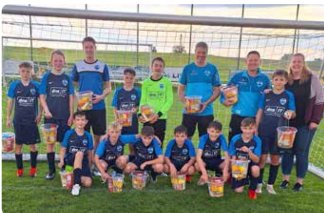
Die Leistung der U13 ist durchwachsen