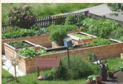
Garten- hochbeete von Nagler-Holz

E-Mail: office@nagler-holz.at | www.nagler-holz.at